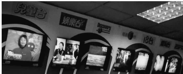
香港ケーブルTV (HKCTV) の提供チャンネル

*1 香港ネットワークTVは〇一年三月に撤退。イエス・テレビジョンは、〇二年二月にVODサービスを開始したが、経営不振から〇四年五月に撤退。パシフィック・デジタルメディアも、後にTVプラス(TV Plus(HK) Corp. Limited: TV Plus)に名称を変更し、〇二年二月に衛星放送を開始したが、経営不振から〇四年四月に撤退した。