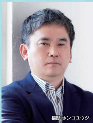
ま やま じん 真山 仁 小説家

1962年大阪府生まれ。新聞記者、フリーライターを経て2004年『ハゲタカ』（ダイヤモンド社）で小説家デビュー。同シリーズや地熱発電開発を舞台にした『マグマ』（角川文庫）、東京地検特捜部の検事が主人公の『売国』『標的』（共に文春文庫）、日本の財政破綻問題を描いた『オペレーションZ』（新潮社）、日本最強の当選請負人が主人公、選挙の裏側にスポットを当てた『当確師』（光文社文庫）などドラマ、映画化作品も多数。最新刊は『当確師 正義の御旗』（光文社）。